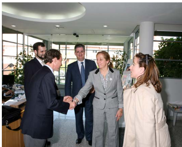
Emilio Butragueño a su llegada al Colegio Sek Ciudadcampo

El ciclo de conferencias del Aula de Cultura SEK 2006-07 celebró su acto inaugural el día 11 de abril a las 16 horas , en el colegio CIUDALCAMPO de Madrid, con la Conferencia titulada “Liderazgo y deporte” a cargo de Emilio Butragueño, deportista y ex vicepresidente del Real Madrid.