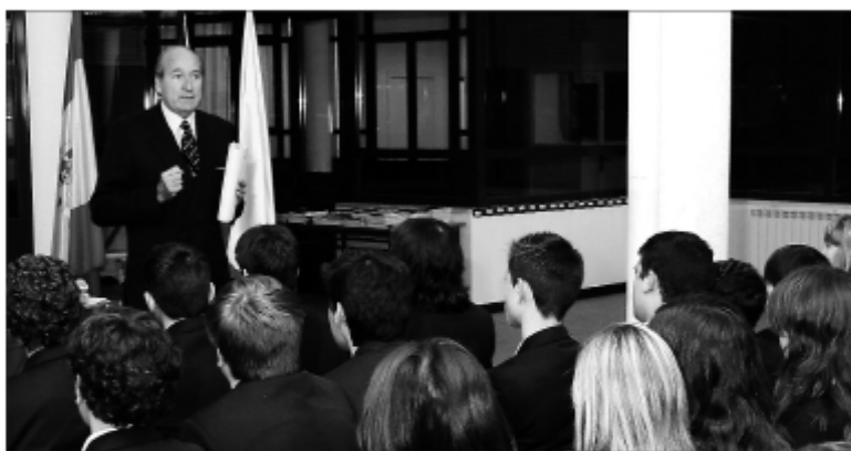
Conrado Durán, presidente de la Academia Olímpica Española, dando una conferencia sobre el movimiento olímpico a estudiantes de la SEK.